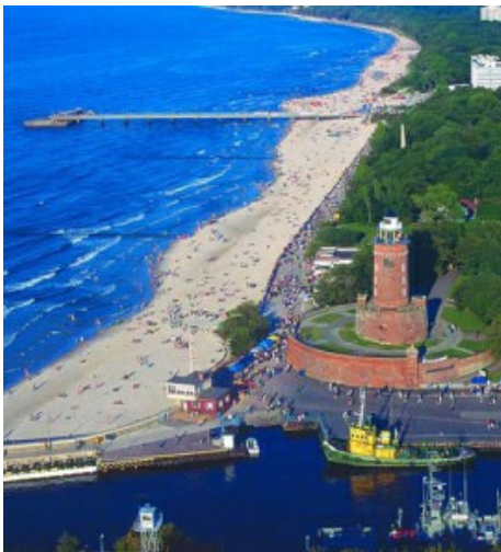
Leuchtturm von Kolberg am Ostseestrand

Kolberg, eine Stadt, die in den letzten Monaten des 2. Weltkrieges zu 90% zerstört wurde, ist in alter Pracht wieder erstanden. Es ist eine Stadt, bei der es sich lohnt, an verschiedensten Örtlichkeiten inne zu halten, um die vielen auch maritimen Schönheiten zu bewundern.