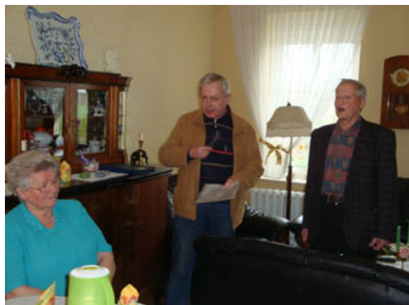
Ständchen für den Jubilar

Bevor sich die Schar seiner Freunde von der Senioren-Union verabschiedet, gibt der Gastgeber noch zum Besten, dass dem Kutscher Fontanes namens Moll neben mehreren Ländereien in Glienicke auch dieses Gleitzesche Grundstück gehört hat. Das darauf 1899 erbaute schicke Haus ist eine Art Eingangs- bzw. Ausgangspforte Glienickes. Moll wurde neben der Glienicker Kirche beerdigt.