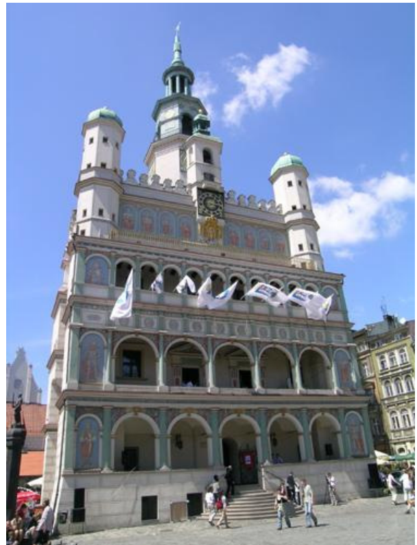
Rathaus von Poznan

Einwanderer konnten wir uns beim Besuch der „Bamberger Gesellschaft“ überzeugen. Vor mehr als 250 Jahren waren Deutsche nach Polen gerufen worden und haben dort – wenn auch nur in einer zahlenmäßig überschaubaren Gruppe – vielen Widerwärtigkeiten zum Trotz ihre nationale Kultur bewahrt.