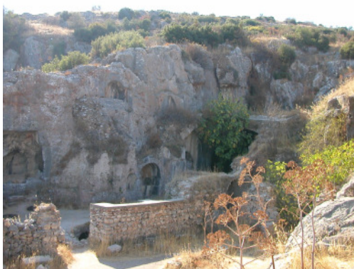
Höhle der Siebenschläfer bei Ephesus ( http://heureka.kulando.de )

Quelle: Hermann Kandler: "Die Bedeutung der Siebenschläfer (Ashab al-kehf) im Islam. Untersuchungen zu Legende und Kult in Schrifttum, Religion und Volksglaube unter besonderer Berücksichtigung der Siebenschläfer-Wallfahrt, Bochum 1994)